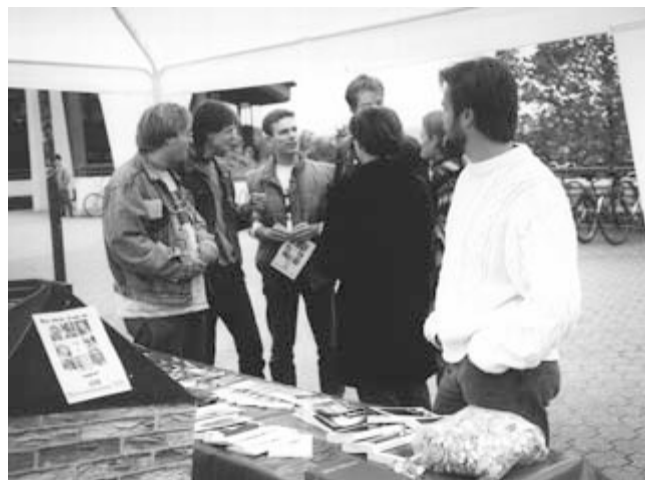
Einsatz Campus Dortmund

In dieser Stadt mit über einer Million Menschen, davon knapp 100.000 Studenten, gibt es ca. 15 evangelikale Gemeinden. Bei einer durchschnittlichen Gemeindegröße von 100 Besuchern entspricht dies ca. 0,15% der