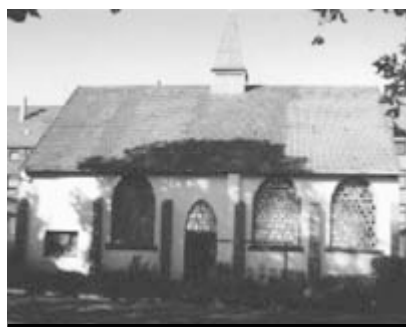
Das Haus des Gebetsvereins

Köln war die erste Stadt Deutschlands mit einer städtischen Universität (1388). Heute studieren hier über 56.000 Studenten, womit sie die größte Hochschule Nordrhein-Westfalens und die zweitgrößte der Bundesrepublik ist. Hinzu kommen vier Fachhochschulen, die Deutsche Sporthochschule,