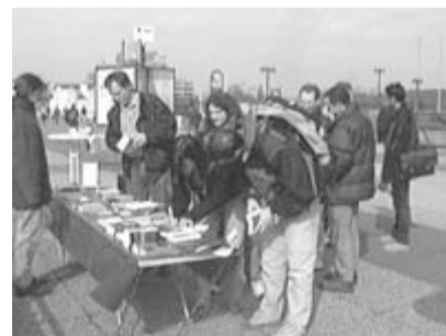
Auf dem Campus der Uni Bochum

meisten Menschen in diesem Alter. Sollten sie sich darüber hinaus entscheiden, in die Gemeindegründungsarbeit mit voller Energie einsteigen zu wollen, so können sie dies tun, ohne durch größere Bindungen gehindert zu sein. Eine weitere großartige Möglichkeit einer Arbeit unter Studenten besteht darin, Menschen aus vom Evangelium nahezu unerreichten Ländern wie z.B. Saudi Arabien, Afghanistan, China, Iran, Nord-Korea oder Vietnam zu Jesus zu führen. In diesen Ländern ist missionarisches Arbeiten auf Grund von staatlichen Verfolgungen nur unter schwersten Bedingungen möglich. An den Universitäten haben wir die Möglichkeit, diese Nationalitäten mit dem Evangelium