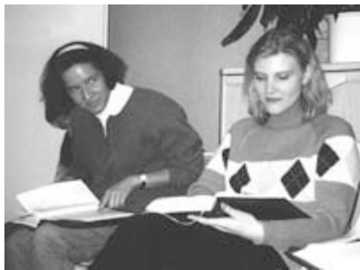
Bibelstudium im Hauskreis

Nach den ersten Einsätzen an der Universität Dortmund und dem Start eines christlichen Studentenkreises (CSK) traf man sich 1992 erstmals auch sonntags morgens zu Gottesdiensten in einer Privatwohnung. Da einige der